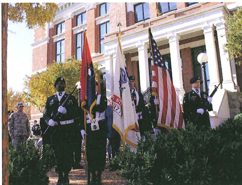
Color Guard van de 101e

De parade werd voorafgegaan door surveillanceauto's van de Sheriff's